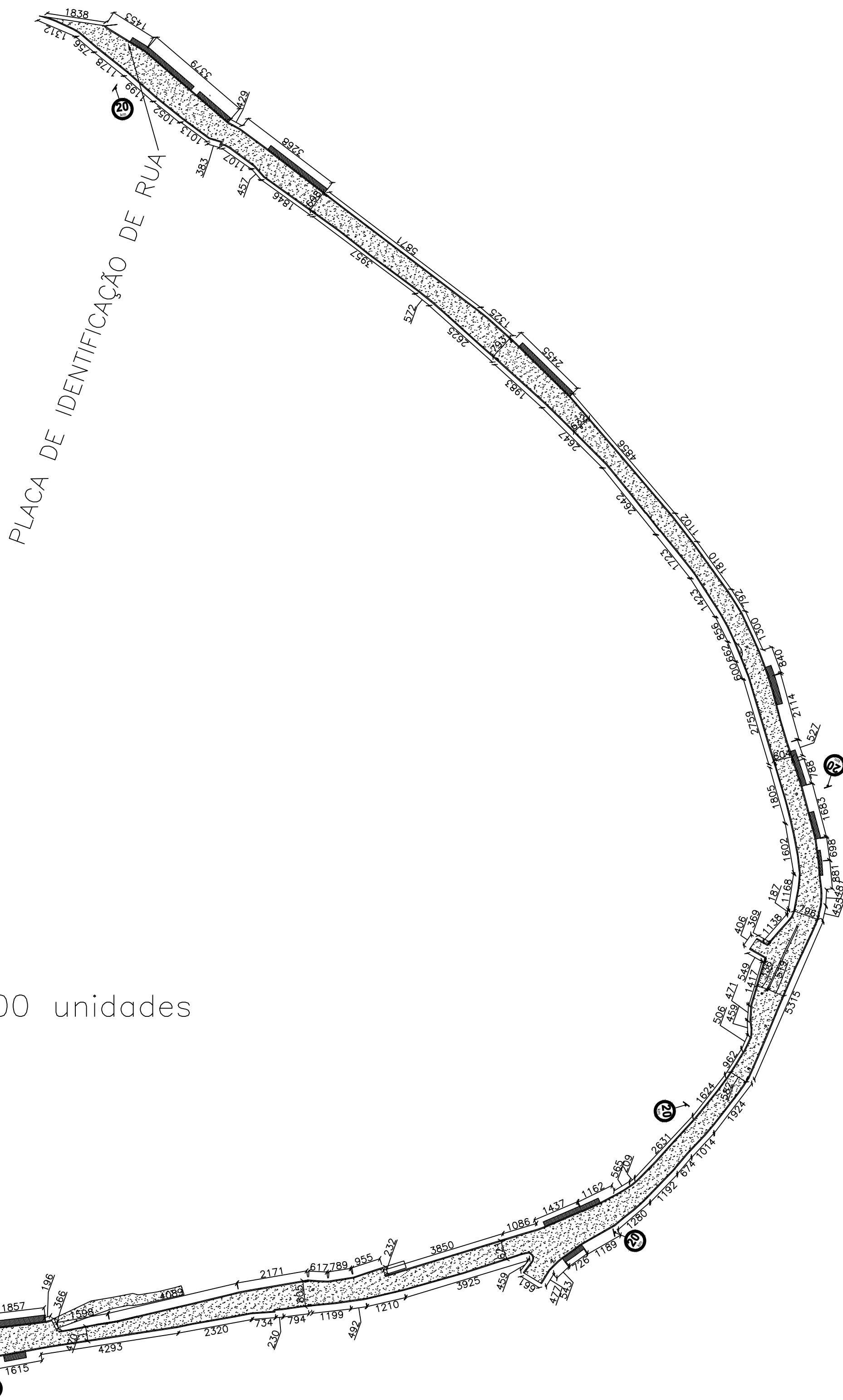
DETALHE DE PLACA

Placa de Identificação de rua: 2,00 unidades